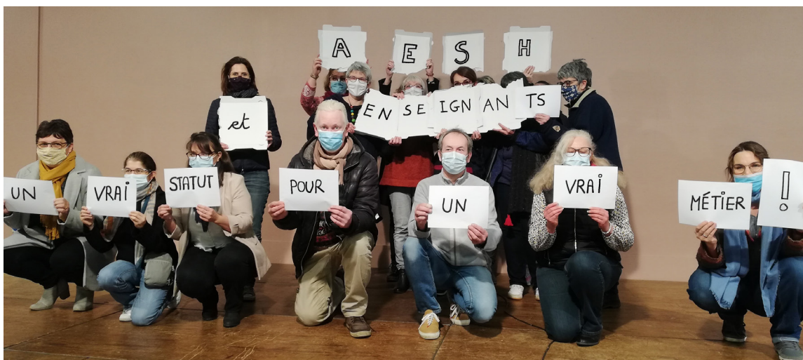
Photo prise lors du stage de formation syndicale "AESH & Enseignant-es : collaborer dans une école inclusive" du 19 janvier 2021

Dans l'Oise, un rassemblement aura lieu à 14h devant la DSDEN de Beauvais (Avenue Victor Hugo).